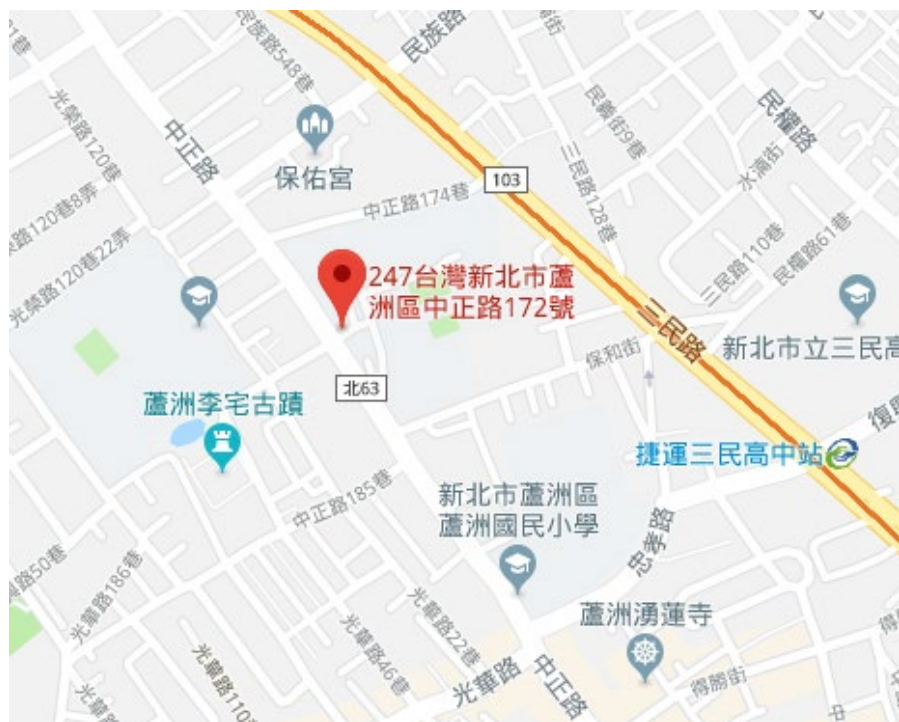
國立空中大學蘆洲校本部平面圖