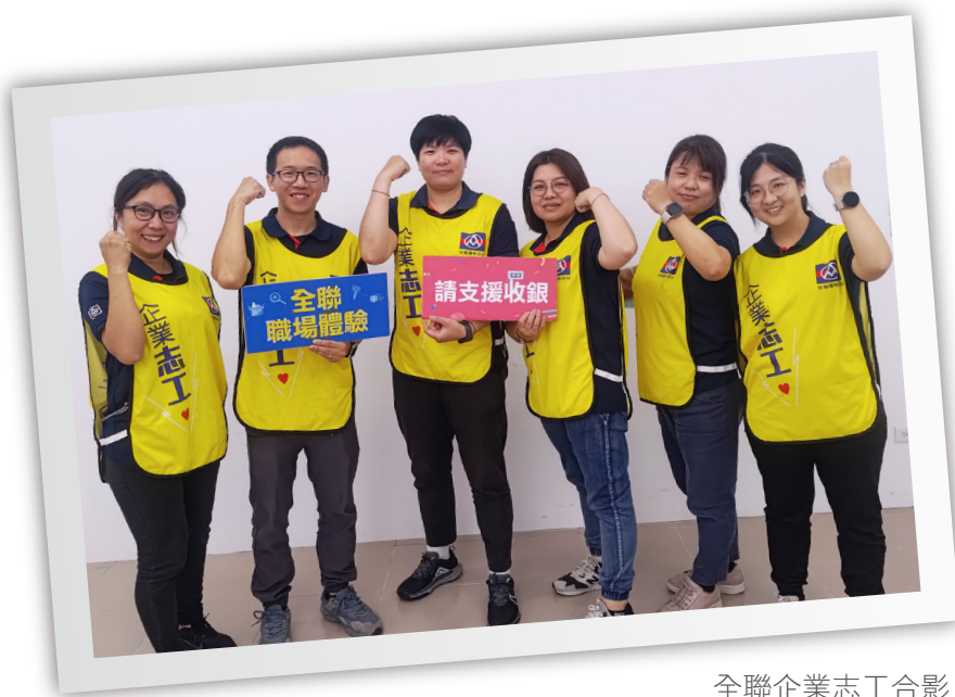
全聯企業志工合影