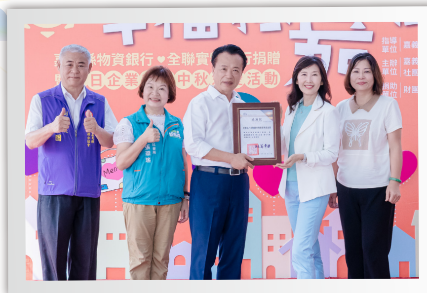
嘉義縣政府實物銀行捐贈儀式